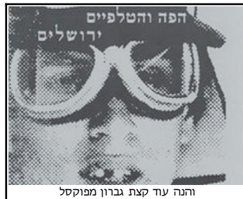
והנה עוד קצת גברון מפקסל

בכניסה לשנה ה-18 לקיומם הסמי ווירטואלי, יש איזו מידה של אירוניה בעיסוק סביב להקת "הפה והטלפיים" - אם בתחילה עיקר העיסוק סביב הלהקה היה בשאלה מי לעזאזל חברים בלהקה הזו, ואחר כך בקוד שמכתיב את פעילותו של ההרכב ("כל שש שנים", "אין על קסיו" וכו'), הרי שכעת, סוף-סוף, מאזן האימה השתנה. נדמה שעד השנה, "הפה והטלפיים" עמדה מנגד כשהעיתונים והאינטרנט התמלאו בקשקושי טריוויה על אחת מהבעיטות החדות ביותר לצלעות ששוגרו במחיקה הישראלית ואילו לקראת "קליגרו", אלבומם החדש, משהו בשקט הזה התערער: בראשית היה קליפ, לאחר מכן הופעת רדיו וכעת הפה מוציאים סינגל, "זה" (ויש גם רינגטון, רחמנא ליצלון). הם ממשיכים לשכתב עד זרא את אותו קוד, ומתגנב החשש שהתוכן והמסתורין זו הצידה. זה אמנם נחמד מאד ששניים מהיוצרים הציניים ביותר שידעה התרבות הישראלית (אסף גברון ואהד פישוף) מתייחסים בכזו התלהבות ל"מסורת", אך קצת קשה לראות ראיונות פרומו ממי שיצרו את "שיר סיום" והפכו את "גבעת התחמושת" לגרסה מודרנית של "על השחיטה".